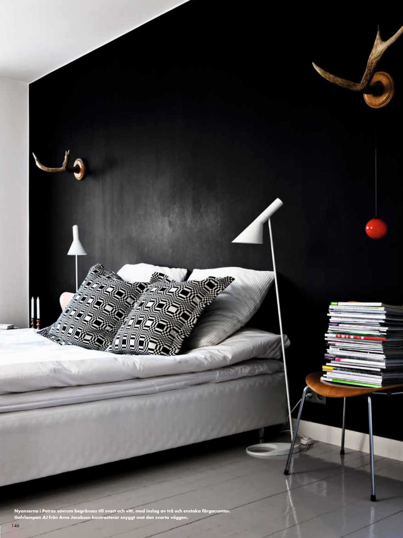
Nyanserna i Petras sovrums begränsas till svart och vitt, med inslag av trä och enstaka färgacenter. Golvlampan AJ från Arne Jacobsen kontrasterar snyggt mot den svarta väggen.

Från vänster: Badrummet är litet, men välutrustat. Kaklet och badkarets mosaik går ton i ton och ger känslan av att väggen bara fortsätter. En mur av gardiner döljer sovrummets garderobslösning. Den klassiska fladdermusfåtöljen bryter av med rena linjer. Petras sovrums separeras från köket med ännu en lång vit gardin – en lösning som gagnar både akustik och öppenhet. Huset i ett snöklätt Helsingfors.