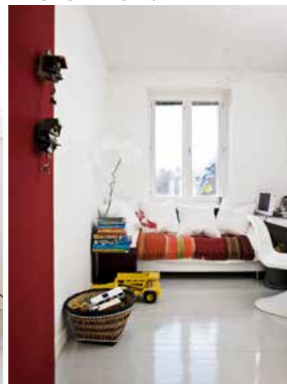
Vänster: När dörren till Milos rum är öppen förstärks känslan av ljus och rymd. Arne Jacobsens Ägget , små teakbord från Petras barndomshem och lampan Taccia , design Achille and Pier Giacomo Castiglioni för Flos. 7-åriges sonen Milos dörr är fodrad med röd filt. Vit stol från Panton.