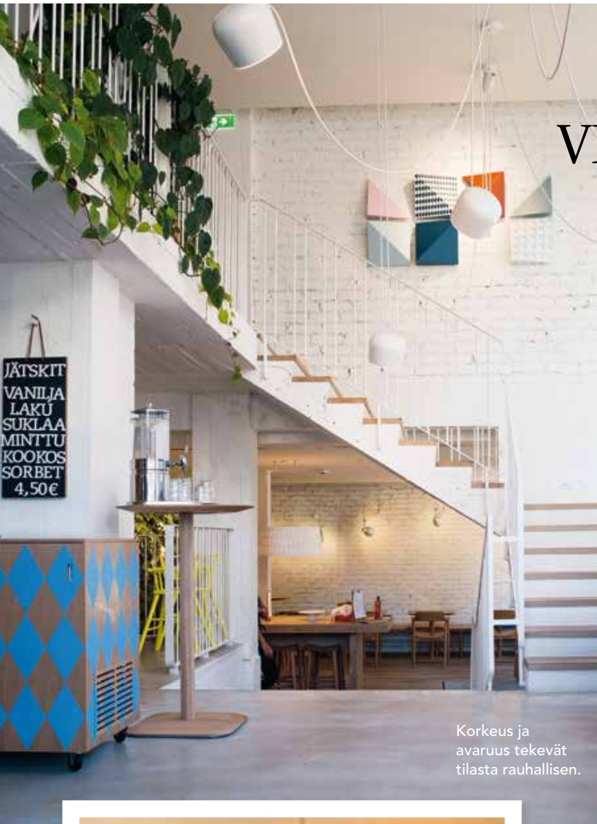
Korkeus ja avaruus tekevät tilasta rauhallisen.