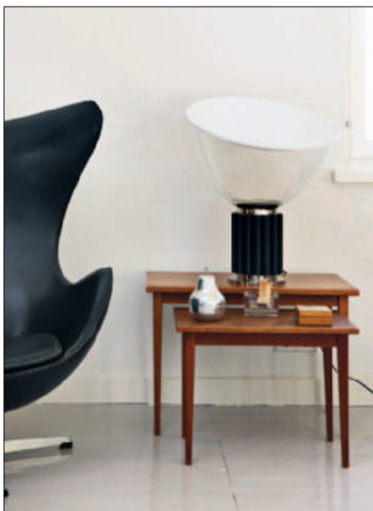
Et hyggeligt hjørne med Arne Jacobsens Ægget, små teaktræsborde og lampen Taccia fra Floss. Elegant i både former og farver.

En 80 kvadratmeter stor lejlighed i et boligkompleks i Helsinki fik den helt store overhaling og genopstod med en helt ny rumoplevelse, masser af lys og åbenhed