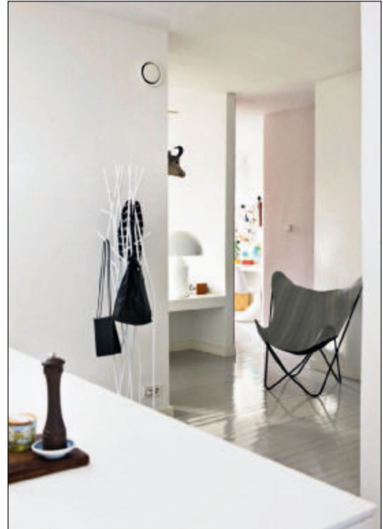
Fra åbningen mellem soveværelse og køkken ses det meste af lejligheden i sin fulde udformning.

der en positiv synergieffekt, og hele lejligheden blev en helhed.