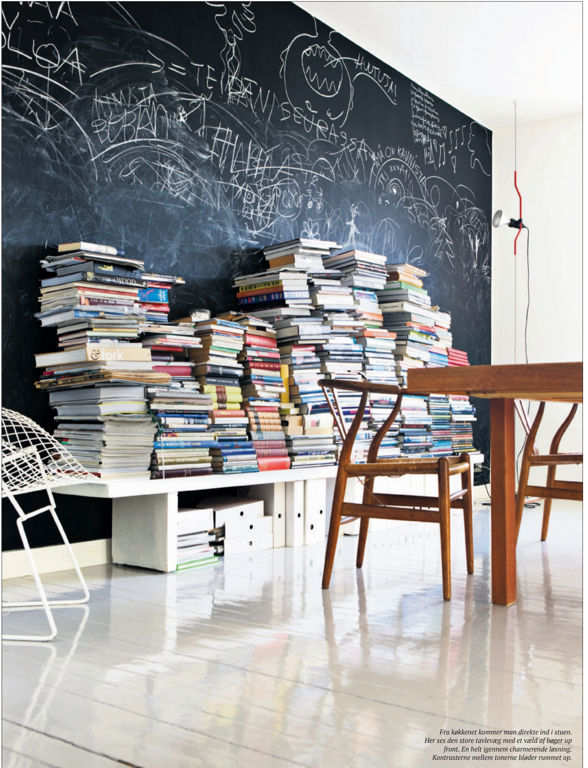
Fra køkkenet kommer man direkte ind i stuen. Her ses den store tavlevæg med et væld af bøger up front. En helt igennem charmerende løsning. Kontrasterne mellem tonerne bløder rummet op.