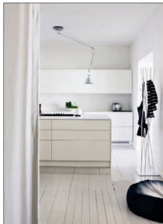
Fra hoveddøren ses køkken og lidt af entréen. Det er et og samme rum, hvor alt er hvidmalet og enkelt bygget op. Køkkenelementerne er specialbygget.

■ FORFRA Af Lykke Foged