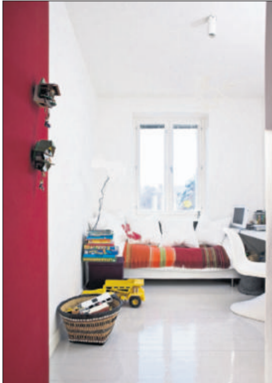
Sønnen Milos værelse. Bokse og kasser løser opbevaringsproblemet med legetøj etc.