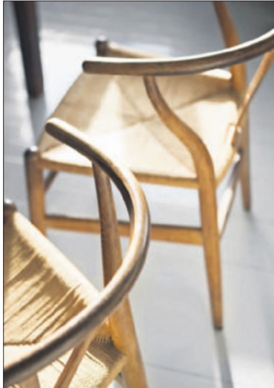
Wegners Y-stol i selskab med det hvidmalede trægulv i stuen, og det flotte lysindfald fra vinduet samme sted.