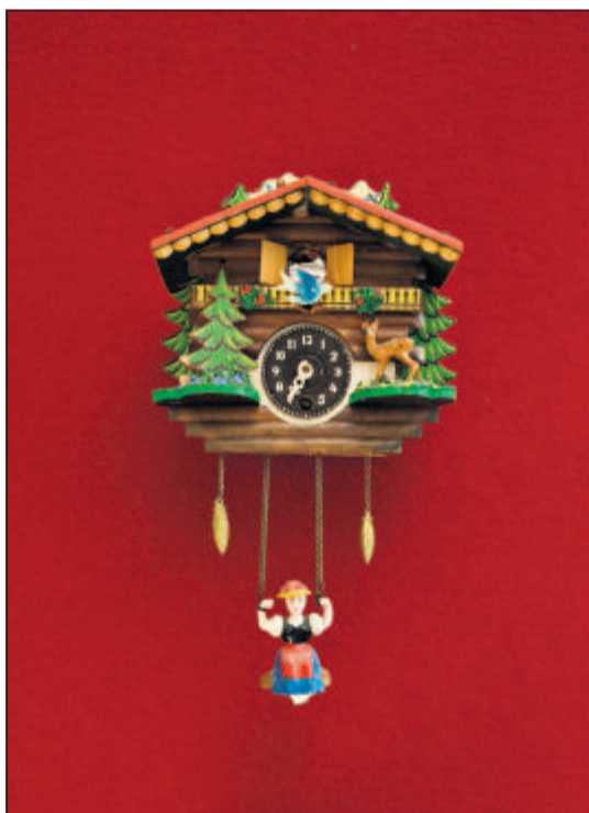
Hyggelige små kukure, der tager sig charmerende ud på den røde dør med filtbeklædning i sønnen Milos værelse.