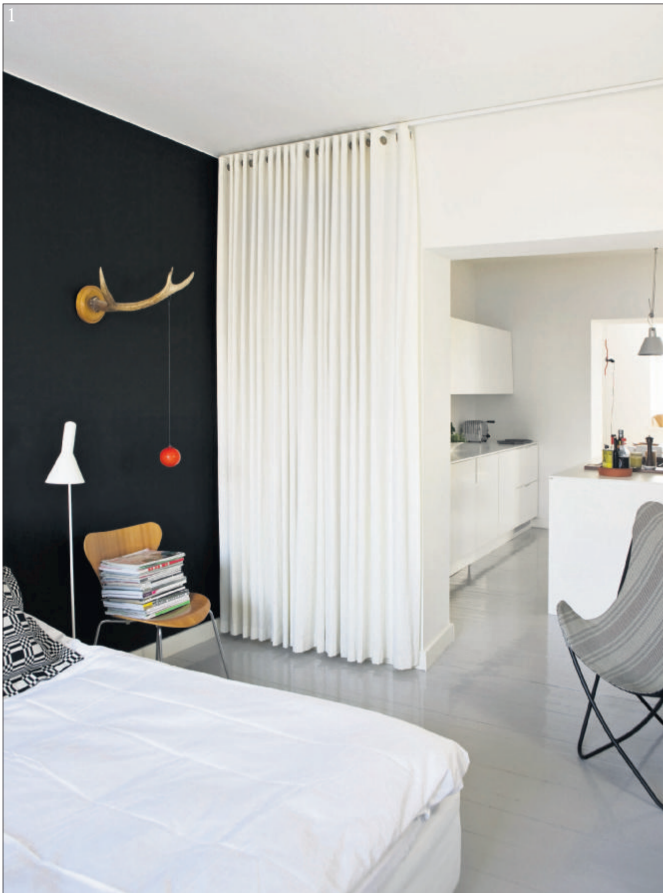
1. Fra soveværelset ses mod køkkenet, hvor de åbne vidder kommer til deres ret. Her opleves den 80 kvm lejlighed stor i al sin åbenhed. Ingen vægge stopper blikket, ingen overgange, der skal passeres, heller ikke for lyset, der flyder delikat mellem rummene.