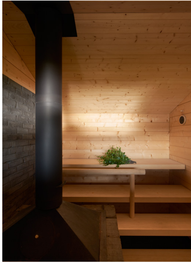
Komea tiilimuuri hallitsee löylyhuonetta. Kiuas on kertälämmitteinen. Vastakkain sijoitetut lauteet ovat pihtaa. Kaide on asennettu juuri oikealla korkeudelle, jotta sen päällä on mukava lepuuttaa jalkoja.